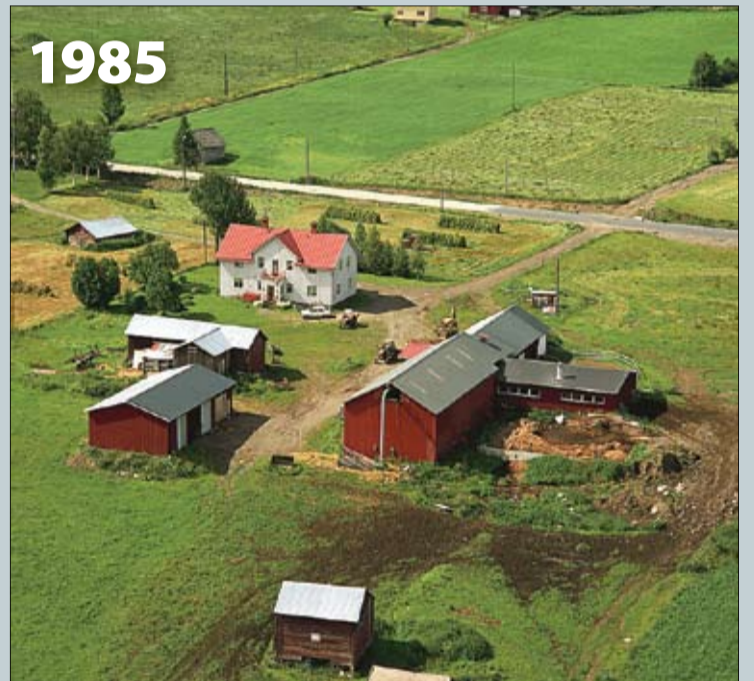
Bilden är tagen den 25 juli 1985. På bilden kan man se den nya ladugården som byggdes för uppbinden mjölkproduktion. Det fanns plats för cirka 24 kor.