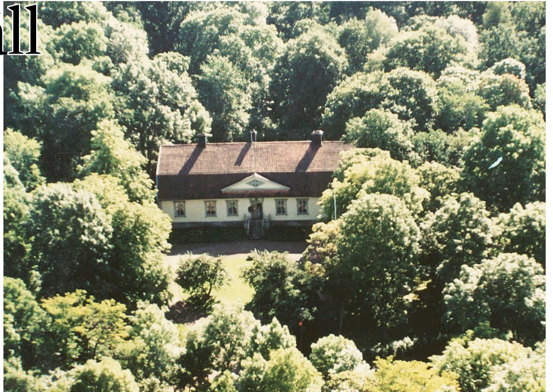
Lundby Säteri 1956. Byggnaden drabbades av eldsvåda på 1970-talet men byggdes upp i samma stil igen.

Glenn kommer från keltiskans "gleann" som betyder "smal dalgång". Namnet kom hit i början av 1900-talet. På 1960-talet började det öka i popularitet. Omkring 5 700 heter Glenn, cirka 3 400 har det som tilltalsnamn eller första förnamn.