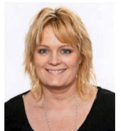
önskar barnen och gubben

Grattis vår älskade Mamma på 45-årsdagen